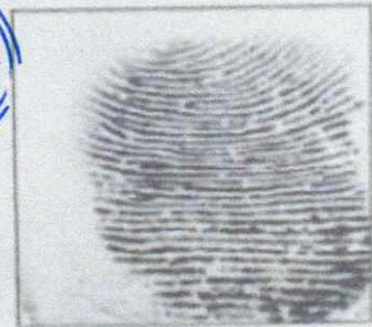
Right Thumb Print