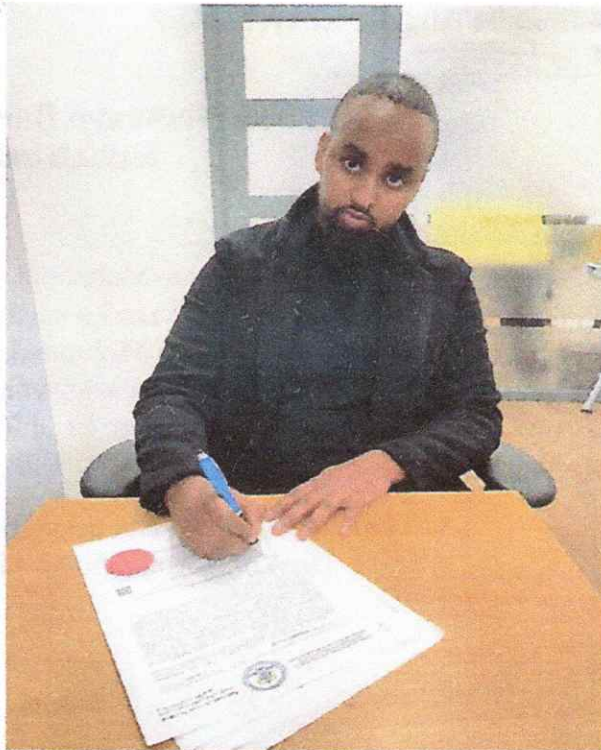
Abdahakim Abdalla Kheyre