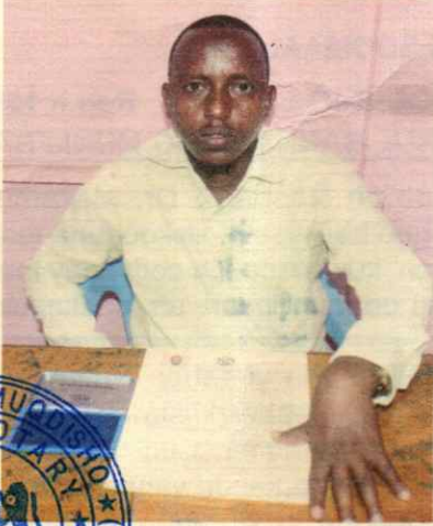
Masawirka laga iibsadaha dhulka