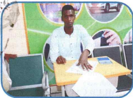
MARAG 2-MAX'ED MAX'UUD MAX'ED