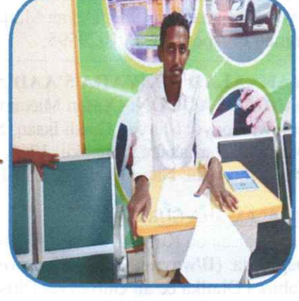
MARAG 1-MAX'ED CABDI CILMI