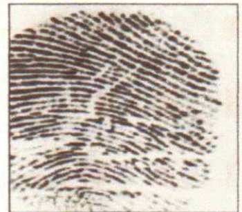
Right Thumb Print

Duqa Magaalada ee Muqdisho Mayor of Mogadishu