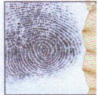
Right Thumb Print