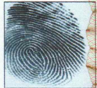
Right Thumb Print