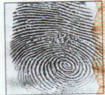
Right Thumb Print