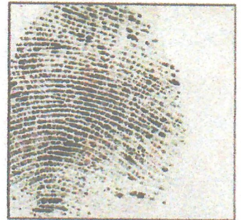
Right Thumb Print

Duqa Magaalada ee Muqdisho Mayor of Mogadishu