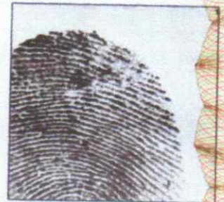
Right Thumb Print