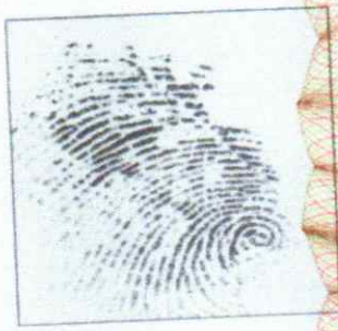
Right Thumb Print