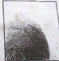
Right Thumb Print