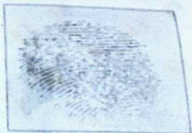
Right Thumb Print