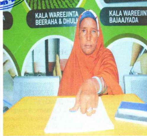
MASAWIRKA DHAXALTOOYADA AHNA LOO QIIMEEYAASHA

Handwritten signature or mark at the bottom of the page.