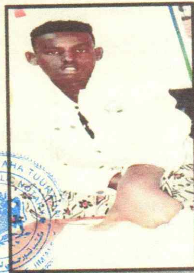
1- C/LAAHI MAX'ED JIMCALE