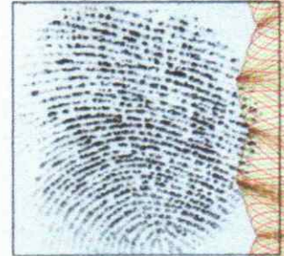
Right Thumb Print